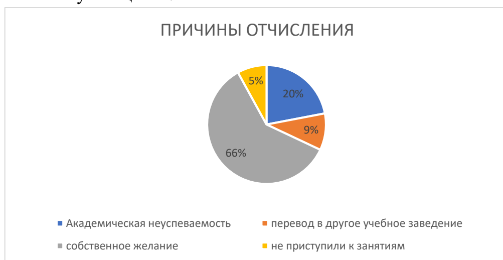
Рисунок 1- Причины отчисления обучающихся

Перевод, отчисление и восстановление обучающихся в колледже осуществлялся на основании положения о переводе, отчислении и восстановлении обучающихся.